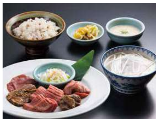
牛たん食べくらべ定食