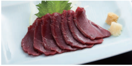
熊本県直送 馬刺し