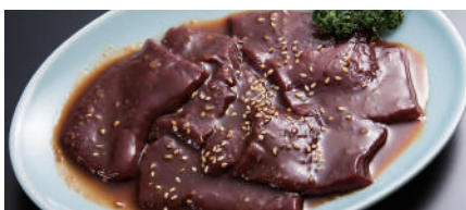
上レバー 900円(税込990円)