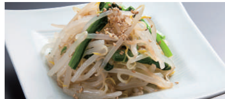
もやしと青菜のナムル