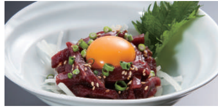
熊本県直送 馬ユッケ