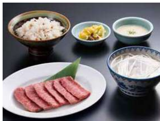
善治郎カルビ定食