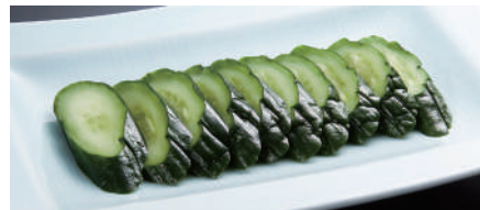
キュウリー一本漬け