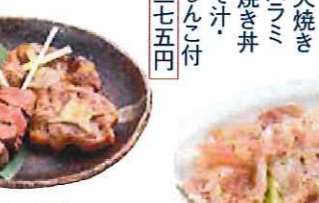
炭火焼き 牛ハラミ 塩焼き丼 みそ汁 おしんこ付 一,三七五円