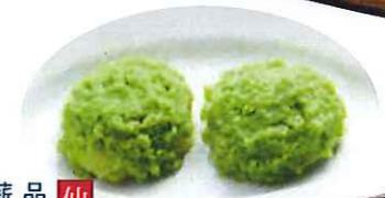
仙台名物 品種国産「秘伝豆」 薪と釜戸でつくった ずんだ餅(2ヶ) 三三〇円