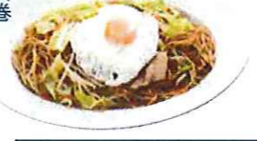
石巻 ソース焼そば 九六八円 牛たん 生ハム 八五八円