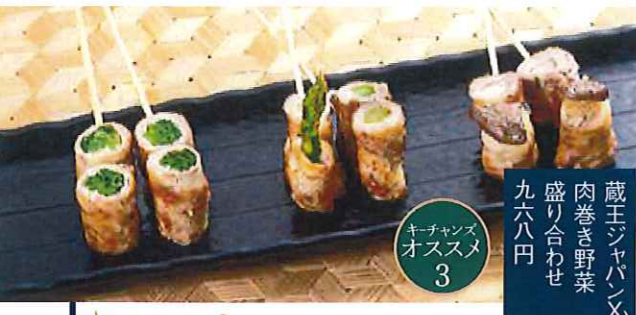
蔵王ジャパンX 肉巻き野菜 盛り合わせ 九六八円