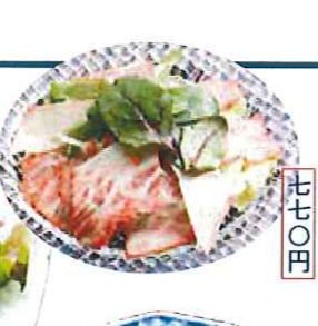
クシヤケイ 七七〇円