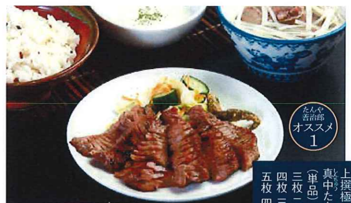
たんや善治郎 オススメ 1 真中たん焼き (単品) 三枚 一,五三〇円 四枚 三,三三〇円 五枚 四,一八〇円

たんや善治郎の牛たんは、仙台牛たん焼きの伝統の味にこだわった「塩焼き」の牛たん。職人が目利きから切り込み、塩ふり、漬け込み、熟成と、全て手作業で仕込んでいます。