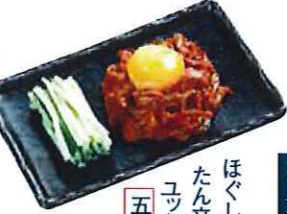
ほぐし牛たん たん辛味 ユッケ風 五八円