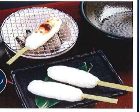
仙台名物 生笹かまぼ焼き (二本) 八三六円