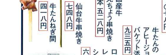
国産牛 丸ちよう串焼き 一本五二八円 九三五円