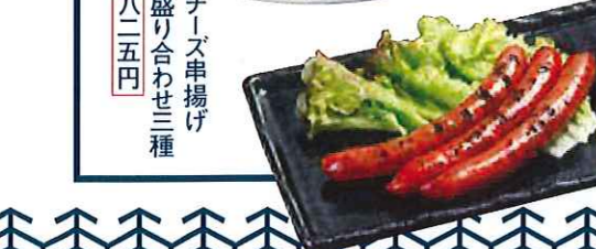
牛たん ソーセージ 四九五円