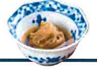
牛たん入り 青唐辛子味噌 一三二円