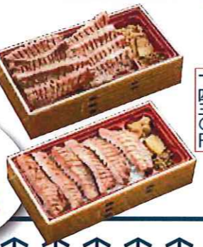
お持ち帰り 牛たん弁当 6切れ 一,六八〇円 8切れ 一,四三〇円