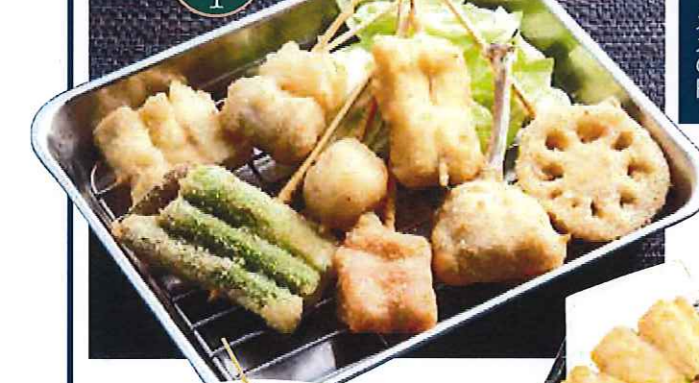
キーチャンズ オススメ 1