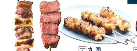
キーチャンズ オススメ 3