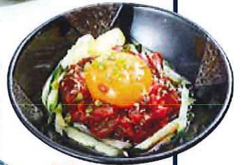
ほぐし牛たん たん辛味 ネギ和え 四一八円