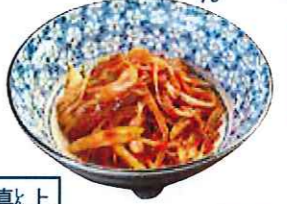
クシヤケイ 七七〇円