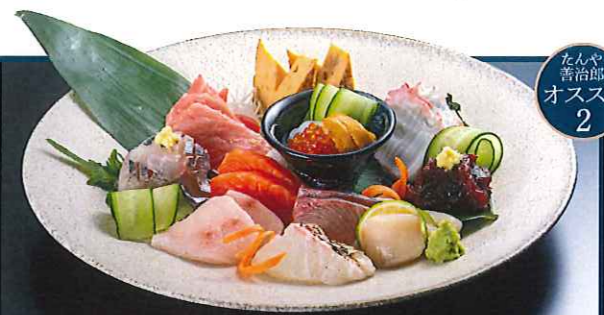
三陸満載！ 海鮮10点盛り合せ 1,2人前 三,〇八〇円 2,3人前 四,一八〇円 3,4人前 五,〇八〇円