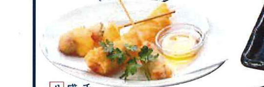
チーズ串揚げ 盛り合わせ三種 八二五円