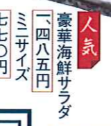
人気 豪華海鮮サラダ 一,四八五円 ミニサイズ 七七〇円