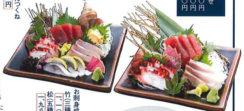
お刺身盛り合わせ 竹(三種) 一,〇〇〇円 松(五種) 一,九八〇円