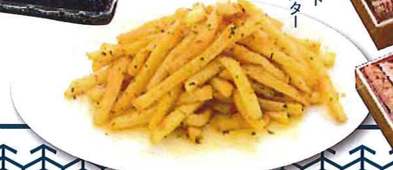
GBSポテト (ガーリックバター 醤油味) 四九五円